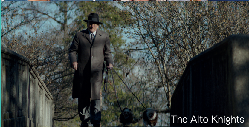
The Alto Knights